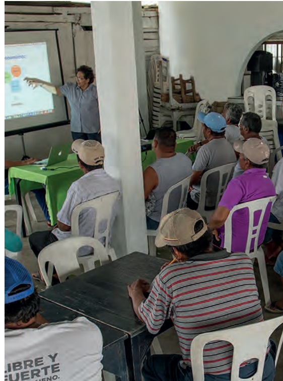
Foto 1. Grupo de trabajo del Instituto de Ciencias Marinas y Pesquerías de la Universidad Veracruzana, en capacitación a sociedades cooperativas en Antón Lizardo, Alvarado, Veracruz.